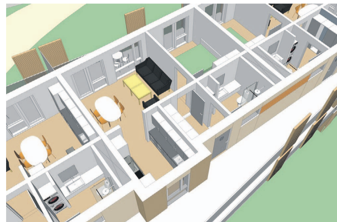
Illustration: Bo42/Steenbergs Tegnestue