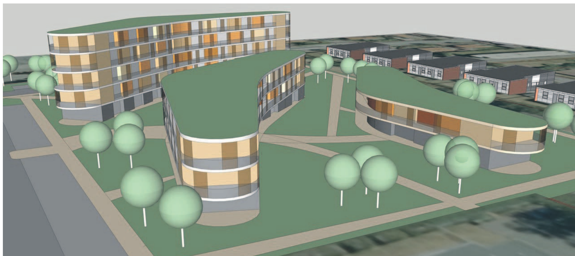
Illustration: Bo42/Steenbergs Tegnestue

Projektet Boomeranghusene er i første omgang afvist af regionskommunen, som har sat skolen og sportspladsen til salg sammen: